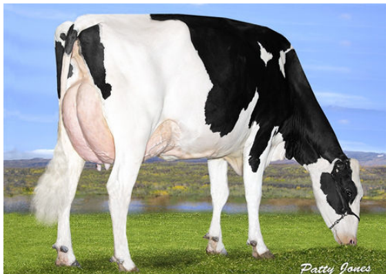
OCD DELTA MISSY GRANDDAM