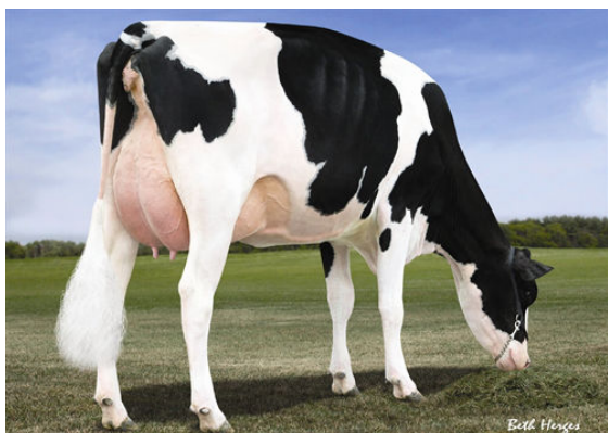
MORSAN MAN D MISSY FOURTH DAM